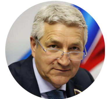
Первый заместитель председателя комитета Государственной Думы по охране здоровья Леонид Анатольевич Огуль

Мы призываем педагогическое сообщество активно сотрудничать с медицинскими специалистами, чтобы все учителя обладали необходимыми навыками и знаниями в области оказания первой медицинской помощи. Ведь это не просто полезный навык — это то, что может спасти человеческую жизнь в экстренной ситуации, когда счет идет на секунды.