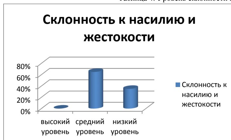
Таблица 4. Уровень склонности к жестокости и насилию.

Исходя из данных таблицы, мы видим, что 67% обучающихся имеют средний уровень склонности к жестокости и насилию, это означает, что они способны причинить вред только в целях самозащиты, удовольствия от чужих страданий не получают; 33% - низкий уровень, у этих студентов слишком занижена